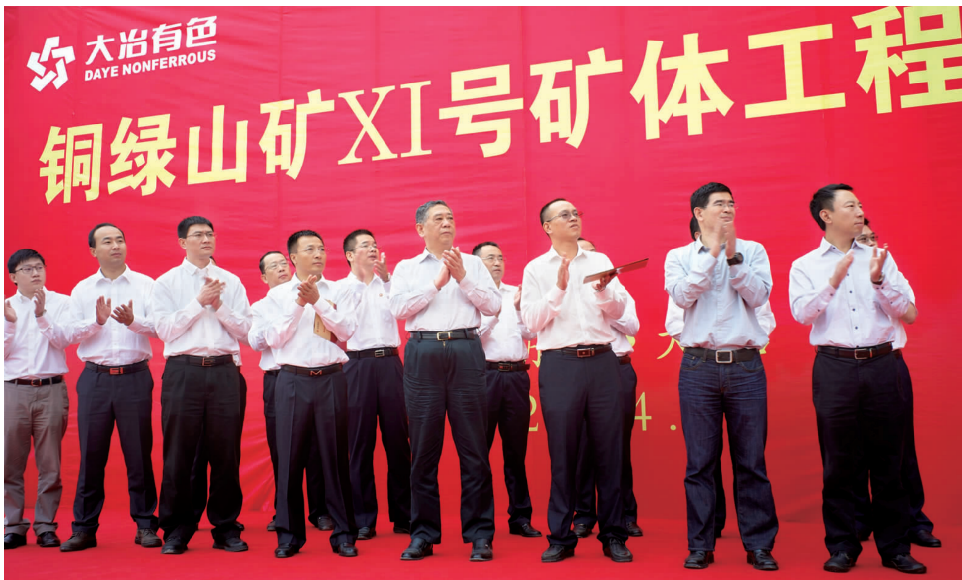
▲ 10 月 18 日，铜绿山矿 XI 号矿体工程建成并正式投入生产。这是中国有色集团总经理罗涛(前排右四)在投产仪式上的情景。

本报讯 “投产，出矿！”10 月 18 日上午 9 时 28 分，随着中国有色集团总经理罗涛的一声令下，铜绿山矿 XI 号矿体工程混合井提升系统缓缓启动，满满一箕斗矿石被运送至卸矿口，这一激动人心的场景标志着该项工程建成并正式投入生产。